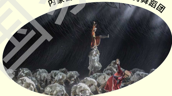
内蒙古艺术学院乌兰牧骑舞蹈团