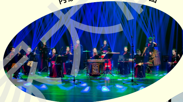
内蒙古艺术学院潮尔乐团