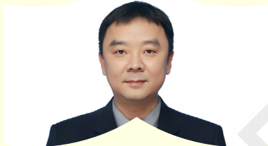
演出统筹 / 王利峰