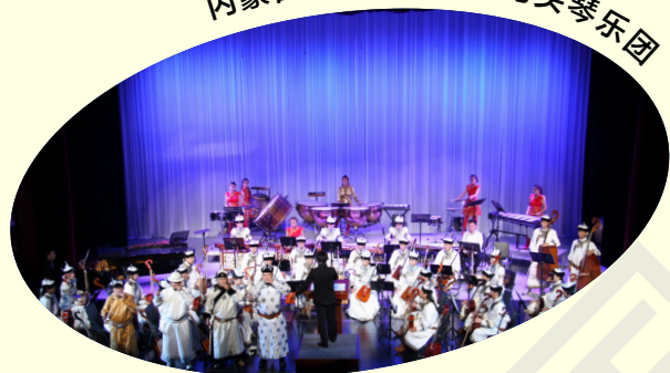
内蒙古艺术学院青年马头琴乐团