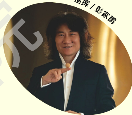
指挥 / 彭家鹏

国家一级指挥，享受国务院政府特殊津贴。第十三、十四届全国政协委员，第76届国际青年音乐联盟执委。中国广播民族乐团、中国歌剧舞剧院、澳门中乐团 (2003-2016)、河南交响乐团、中国东方交响乐团、东方中乐团艺术总监兼首席指挥；乌克兰国家交响乐团、奥地利萨尔茨堡莫扎特交响乐团、奥地利格拉兹交响乐团、韩国釜山国立国乐管弦乐团、捷克国家交响乐团常任客席指挥；2017年6月起任苏州民族管弦乐团艺术总监兼首席指挥。曾获中国金唱片指挥特别奖、中宣部文化名家暨“四个一批”人才、中国十大杰出青年等荣誉。自2000年起连续13年在维也纳金色大厅指挥世界各大乐团，引起巨大轰动，2021年荣获奥地利音乐剧院奖·国际音乐文化成就奖。