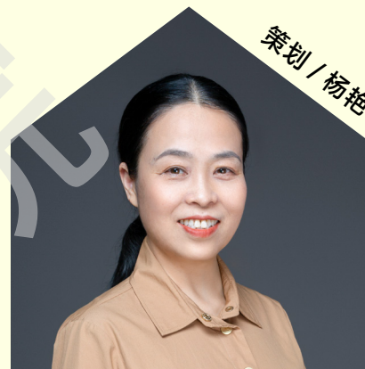
策划 / 杨艳

重庆大学档案馆馆长，研究馆员，秉持“活化校史、赋能思政”的核心理念，深耕档案资源，创新转化路径，将厚重的校史档案转化为可感知、可共情的舞台艺术与思政载体。个人主导策划的《寅初亭》《重大·1929》《何鲁》三部校史话剧，生动再现校史人物精神，引发广大师生与校友情感共鸣，实现了“以史润心、以文化人”的育人目标，让校史档案成为传递理想信念、涵养家国情怀的生动思政课堂。