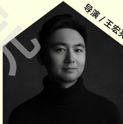
导演 / 王宏亮

学校注重以优秀文化作品传递精神力量，相关成果多次斩获国家级、省部级艺术展演奖项。这些实践不仅夯实了学校文化育人的品牌，更形成了“挖掘校史资料—创排精品剧目—传播精神内核—反哺教学育人”的完整美育生态，真正践行了“一出好戏，照亮一群人”的教育使命。