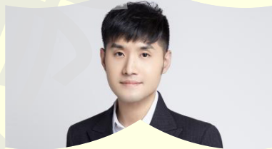
后台统筹 / 史砚琨

国家大剧院党组成员、副院长，总监制，三级教授，硕士研究生导师，北京长城学者。京剧叶派小生第三代传人。全国政协京剧室“新时代戏曲人才队伍建设情况”课题特聘专家，中国文联特约研究员，中国教育国际交流协会国际艺术教育专业委员会第一届理事会副理事长，中国文联文艺理论研究重大课题项目负责人，文化和旅游部部级社科研究课题项目负责人，国家艺术基金以及数十个省部级科研项目负责人。曾成功举办个人大型京昆专场演出，连续四年担任中宣部、文化和旅游部主办的《新年戏曲晚会》执行总导演、副总导演，曾多次带队出访演出、举办戏曲讲座，2015年在美国纽约林肯艺术中心与张火丁合作演出京剧《白蛇传》等。现担任国家大剧院歌剧、话剧、京剧、舞剧、音乐剧等总监制。