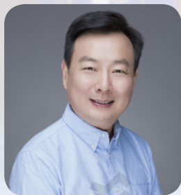
张威 国家一级演员