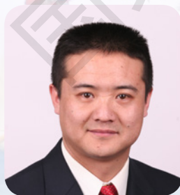
张亚宁 国家一级演员