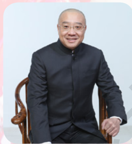
舒桐 中国戏曲学院教授 国家一级演员