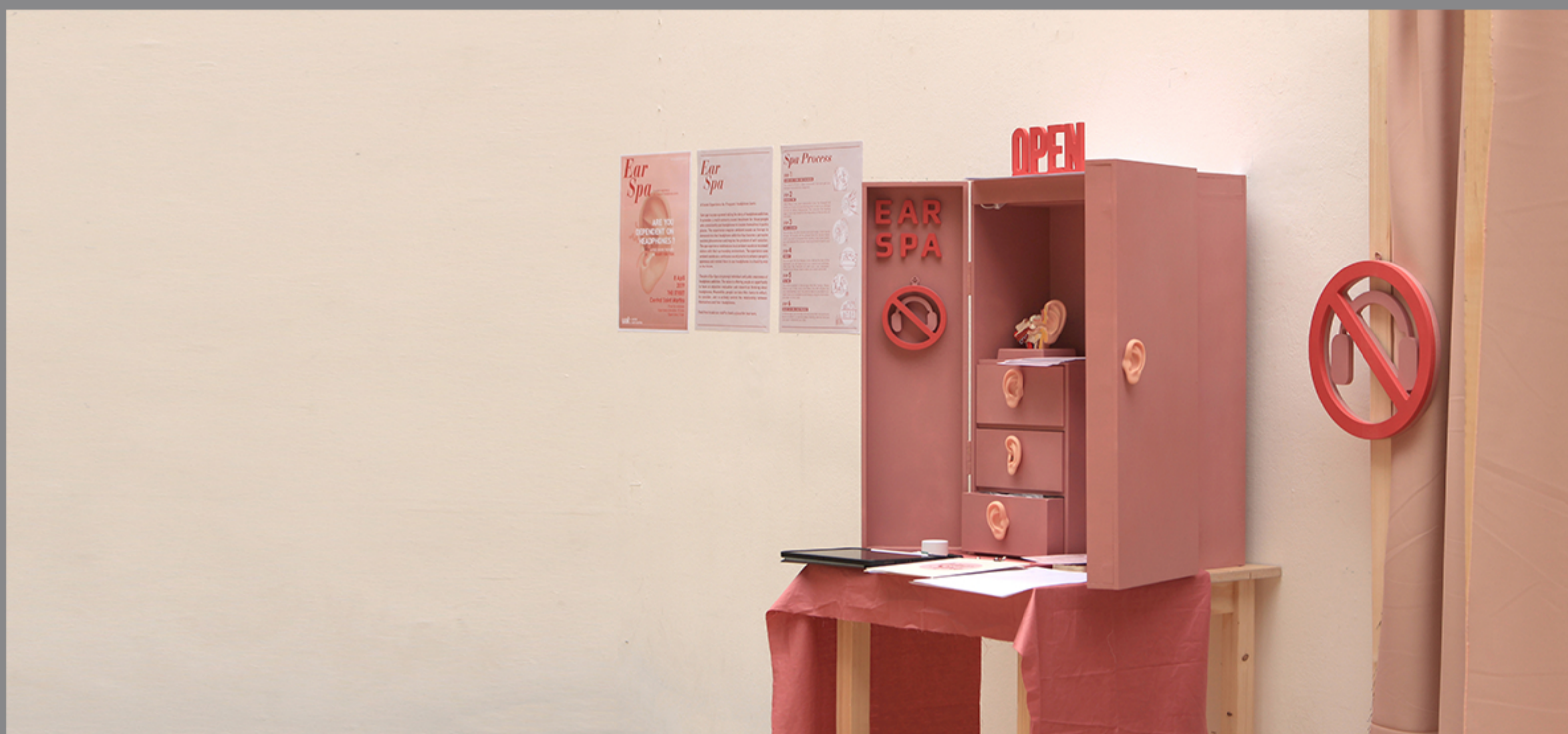
叙事性体验《Ear Spa》设计师：章雯捷